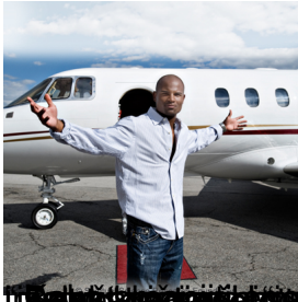
Suptilna slika osobe koja ima ego