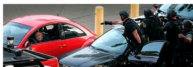
THREE MONTHS AGO, Joseph Moshe, Israeli Microbiologist, called into an LA talk show to warn people Baxter Int's Ukraine Lab was, in fact, producing a bioweapon disguised as a flu vaccine. He was quickly chased, gassed, tasered and taken away by LAPD SWAT Teams.

Naravno, brzo nakon toga bio je uhapšen a prilikom hapšenja počastili su ga tretmanom koji se sastojao od kombinacije plina i tasera, kao da s radilo o nekom opasnom teroristi. Mediji su ga nazvali luđakom koji je planirao da minira Bijelu kuću i ta priča se brzo zataškala a od Moshe od tada ni traga ni glasa.