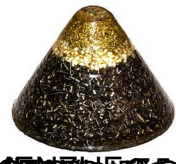
17, 0, 3, 5 je kalcita, špica gorskog kristala u sredini, karneol na