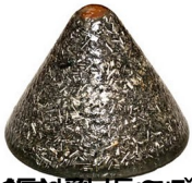
17, 0, 3, 5 je kalcita, špica gorskog kristala u sredini, karneol na