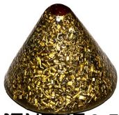
17, 0, 3, 5 je kalcita, špica gorskog kristala u sredini, karneol na vrhu.

...n, čam i ... ...za svaki vrh ... ...u ... ...za