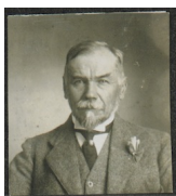
Frederik van Eeden

Riječ je o nizozemskom psihijatru i piscu, Frederiku Willemu van Eedenu, koji je koncem 19. stoljeća započeo s istraživanjem snova. Obzirom da su LaBerg, a i svi ostali prve korake u istraživanju činili po tragovima i ovog čovjeka, zainteresiralo me je, što je on ostavio za sobom.